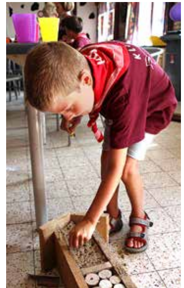
De afwerking van het bijenhotel.

Als dank geef ik jullie allemaal een dikke zoem-zoen!