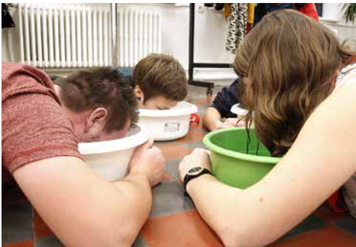
Watervervuiling: zuiveringssystem. De teamleden kunnen afwisselen wie er zuivert en wie naar adem mag happen door de naam van de ander te roepen.

De afvalberg in Europa groeit. De grote hoeveelheden afval en de wijze waarop het wordt verwerkt, zijn niet alleen schadelijk voor het milieu, maar ook voor de mens. Sorteert daarom je afval en plaats afzonderlijke vuilbakken met duidelijk te onderscheiden kleuren (bv. pmd, rest...).