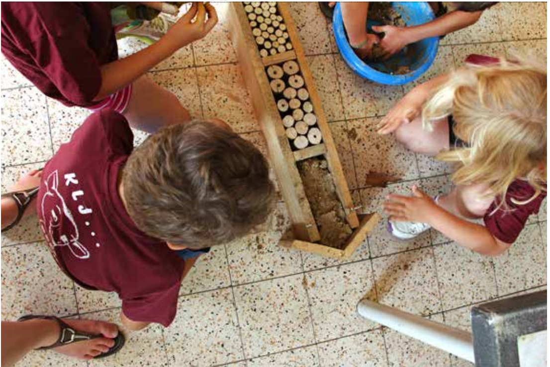
Om een bijenhotel te maken zijn heel wat handige handjes nodig voor je de eerste bijtjes kan verwelkomen.

→ Het begon allemaal enkele weken geleden, vroeg in de ochtend. Ik was net mijn vleugeltjes aan het strekken toen mijn moeder me bij haar riep. ‘Kind,’ zei ze, ‘ik maak me vreselijk ongerust over je zussen! Bollebie en Jacobie zijn gisteren nectar gaan zoeken en ze zijn nog steeds niet teruggekeerd. En vorige week zijn Bizibie en Billiebie ook al verdwenen!’ Ik ging naar hen op zoek en kwam ondertussen verschillende andere bijen tegen. Zij vertelden me dat de mensen niet altijd goed zorgen voor de bijen. Ze besproeien hun velden met bestrijdingsmiddelen om schadelijke insecten weg te houden. Maar de mensen vergeten dat die spullen ook de nuttige insecten ziek maken. Zoals ons, de bijen.