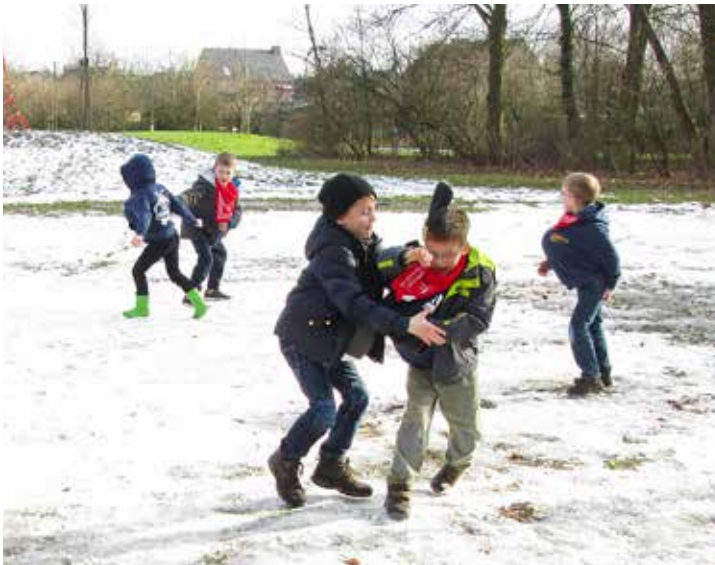
Ballonnenbuik Wie blijft het langst rondlopen met een bolle ballonnenbuik?