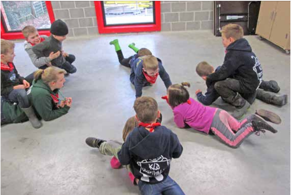
Ontrouwe echtgenoot Het kan niet altijd rozengeur en maneschijn zijn in een relatie!

→ einde een nagel. Leden moeten proberen per twee de nagel in een flesje te krijgen, zonder het touw, de nagel of het flesje aan te raken. Wie hier het eerst in slaagt, wint.