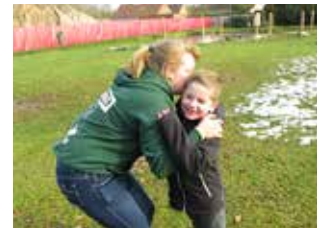
Knuffeltikkertje Een spel met een kat, een muis en veel dikke knuffels.

De leden gaan per twee verspreid over het veld staan en geven elkaar een knuffel. Er is ook een kat en een muis die hier tussendoor lopen.