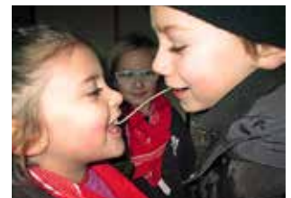
Lady en de vagebond Eet de sliert op tot je elkaar (g)een kus geeft!