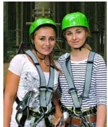
Bij KLJB Sandsbach houden ze ook van avontuurlijke activiteiten.

Om contact te houden met de K in KLJB werken we veel samen met de parochie en met de priester van Sandsbach. Zo helpen we om het altaar mooi te maken voor het oogstfeest en met de organisatie van de kruisweg voor jongeren. We nodigen ook andere KLJB-groepen en dorpsgenoten uit voor deze speciale vie-