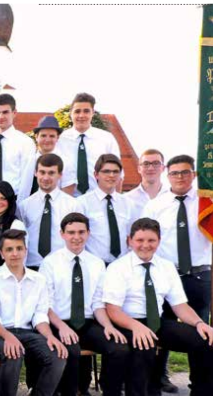
...men we onze jaarlijkse groepsfoto.