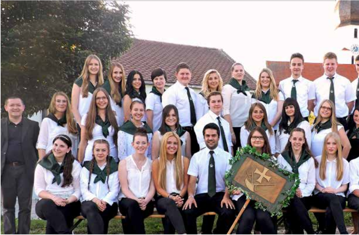
Jaarlijks organiseert KLJB Sandsbach een groot feest om de nieuwe leden te verwelkomen. Hier bespreken we onze plannen en ideeën en na

→ ideaal om geld in te zamelen voor goede doelen. Zo verkopen we kleine broodrolletjes tijdens het oogstfeest en paaseieren bij de paasdienst. De laatste jaren hebben we geld ingezameld voor onderzoek tegen kanker, voor mensen met een beperking en voor de slachtoffers van een overstroming in onze regio.