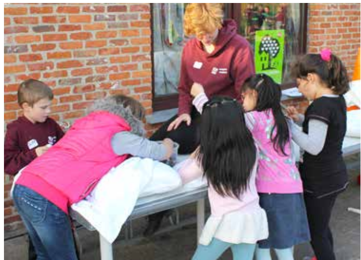
Oude kussenslopen krijgen een nieuw leven na een grondige pimpbeurt.