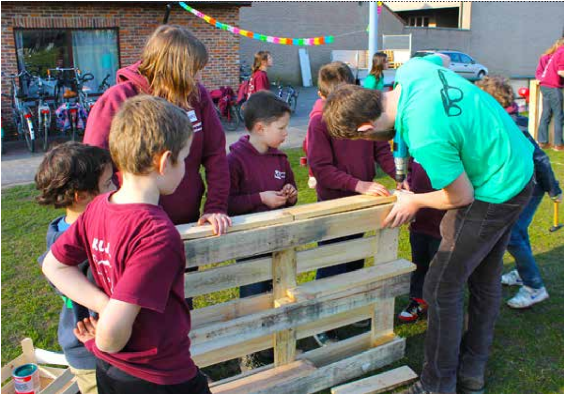
Maak een houten bankstel met paletten en geef het daarna een leuk kleurtje. Wedden dat iedereen blijft hangen na de activiteit?

→ bij elkaar en maken we iets groot. Om aan te duiden welk vakje reeds gebombardeerd is, wordt in dat vierkantje een bierviltje met een nagel geslagen.