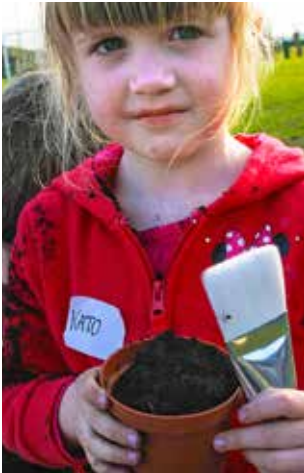
Oei, dat loopt hier 'grondig' fout!