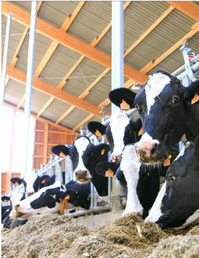
Stop 4: het dessert. Zoek een boerderij waar ze koeien melken en hun eigen hoeve-ijds of ka...

Na het aperitief kunnen we opnieuw vertrekken naar het volgende bedrijf. Ondertussen wordt het tijd voor wat steviger krachtvoer, je hebt nog wel wat te fietsen. Ook nu heb je weer verschillende mogelijkheden. Kies voor een aardappelhandel of boerderij waar aardappelen