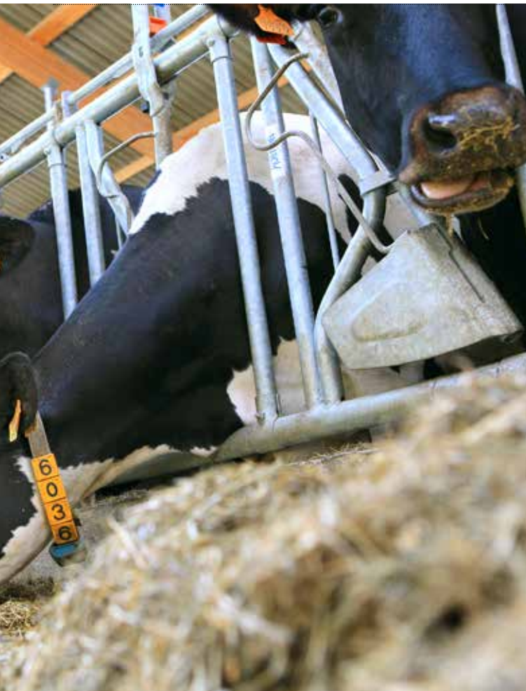
as maken. Hier kan het interessant zijn om de stallen en de melkinstallatie te bezoeken.

worden gekweekt. Dan kan je frietjes bakken of een ander aardappelgerecht maken. Je kan zelfs een boerderij in de buurt zoeken waar varkens zitten. Leg de link met het varken door een worst te geven met een pistolet. Of warme beenhesp tussen een ovenkoek met enkele groentjes en een sausje. Je merkt het, mogelijkheden genoeg! En heb je geen inspiratie meer, sla dan gewoon even een kookboek open.