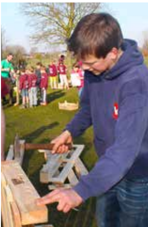
Die zit erin, de volgende!