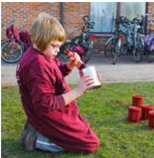
Precisiewerk voor handige handjes.