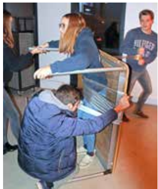
Plak iemand aan een tafel vast zodat hij ondersteboven gehouden kan worden zonder eraf te vallen.