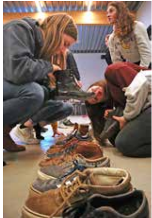
Sorteer alle schoenen van de groepsleden van klein naar groot.