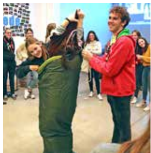
Laat twee personen in een gesloten slaapzak wisselen van kleren.