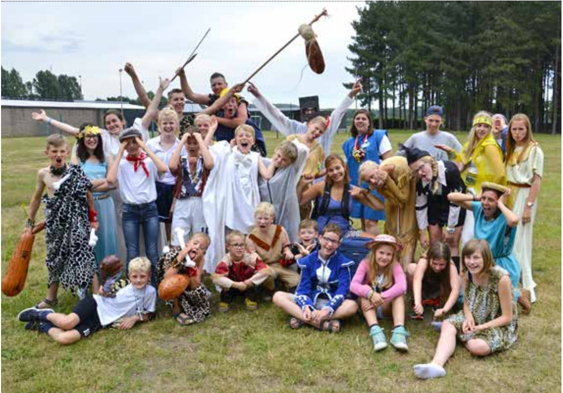
Een kamp staat of valt met zijn thema. Maak eens een reis door de tijd, ga op legerkamp of breng een bezoek aan het sprookjesbos.

heb je in no time een herinnering van die geweldige tijd op kamp.