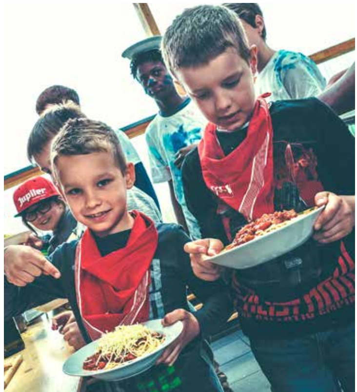
Organiseer een jaarlijks terugkerende kamprecordpoging. Hierbij is het de bedoeling dat er op één dag tijd zoveel mogelijk van product X wordt gegeten.